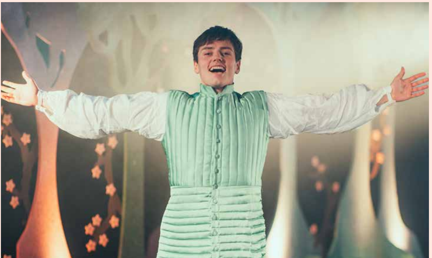
Bilde fra Brageteatrets forestilling «Brødrene Løvehjerte» i 2023.

Vi gleder oss til å møte deg og gi deg en hyggelig opplevelse!