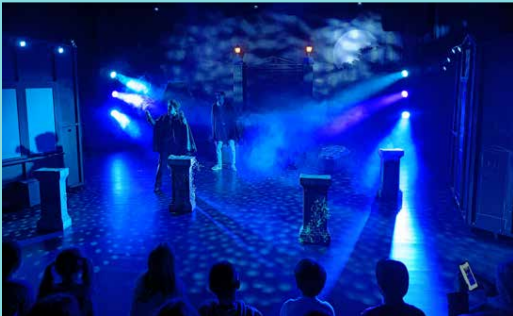
På kirkegården er det ganske mørkt mellom gravsteinene. Det er her den sure vaktmesteren jobber.